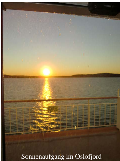
Sonnenaufgang im Oslofjord

te, aber leider aus einem sehr traurigen Grund nicht mit dabei sein konnte.