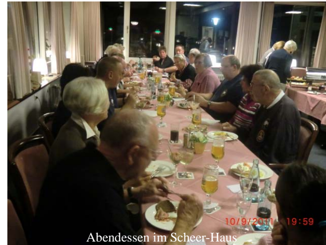
Abendessen im Scheer-Haus

Die MK „Eisbrecher Stettin“ Bonn-Duisdorf begab sich mit 25 Mitgliedern auf eine Mini-Kreuzfahrt von Kiel nach Oslo. Die ersten beiden Tage wurden im Scheerhaus in La-