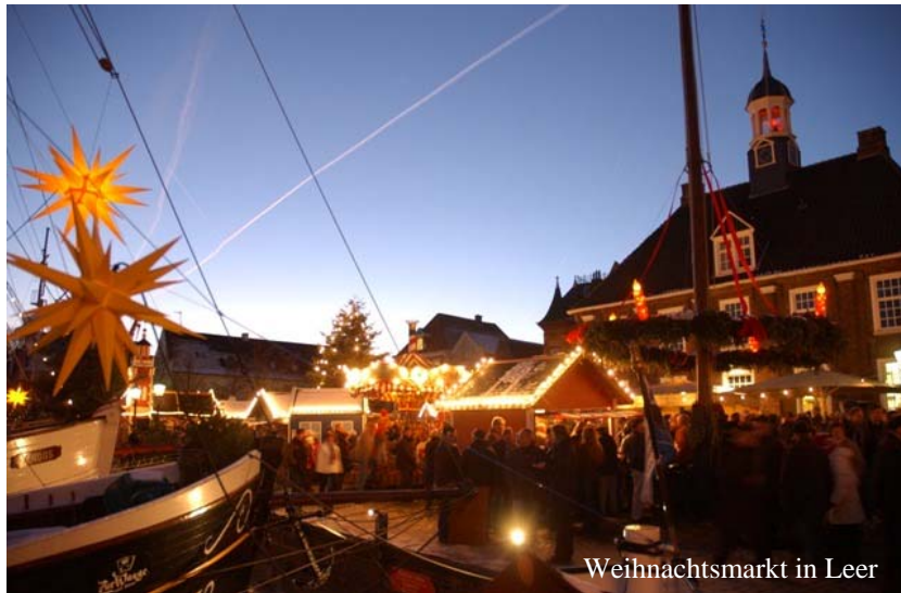
Weihnachtsmarkt in Leer